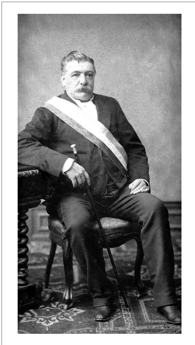
Domingo Santa María. Presidente de Chile 1881-1886.