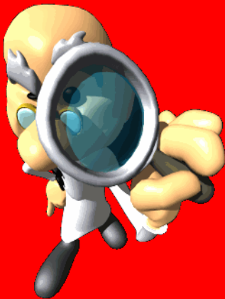
Verdadero o Falso

http://e-historia.cl/metodologiacladi/01cl/asejemplo/evaluaciones/verdaderoofalso.htm