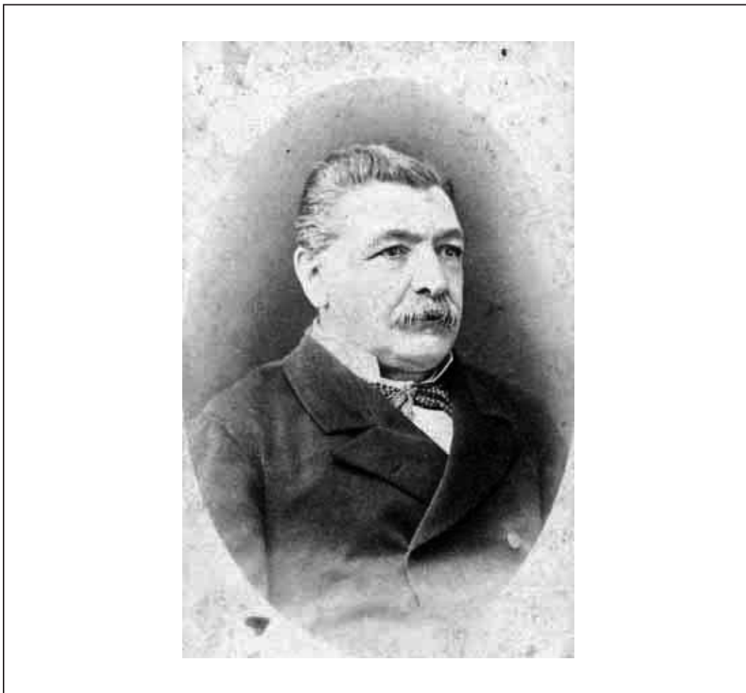
Presidente Domingo Santa María.

ideas claves que destilan los discursos pronunciados por Vergara. Se queja contra los liberales chilenos, porque teniendo la posibilidad de avanzar hacia donde la doctrina y los principios le indicaban, prefieren el estancamiento, por ello las palabras de Vergara son un reclamo contra los liberales que solo han usado la bandera liberal para fines electorales, sin empaparse de sus principios. El 15 de junio, cuando el Ministro del Interior, José Manuel Balmaceda, daba a conocer que la intención secularizadora del Gobierno, respecto de los cementerios, se reducían simplemente a aprobar el artículo único de 1877, 8 Vergara