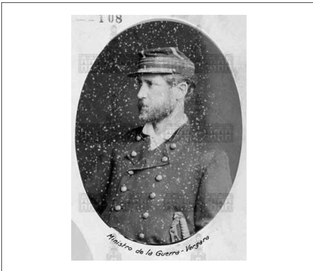
José Francisco Vergara, como Ministro de Guerra, 1881.